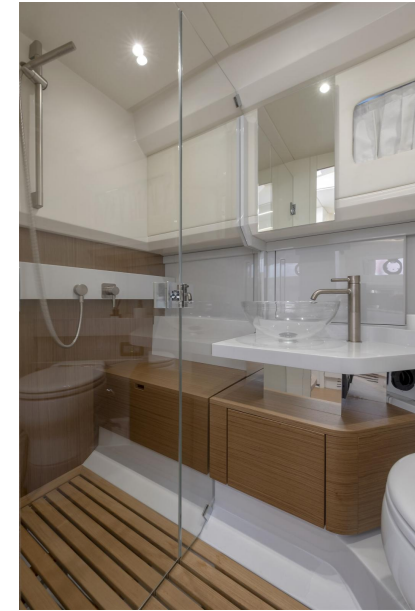
BG42 | 1 cabin, 1 bathroom -STD