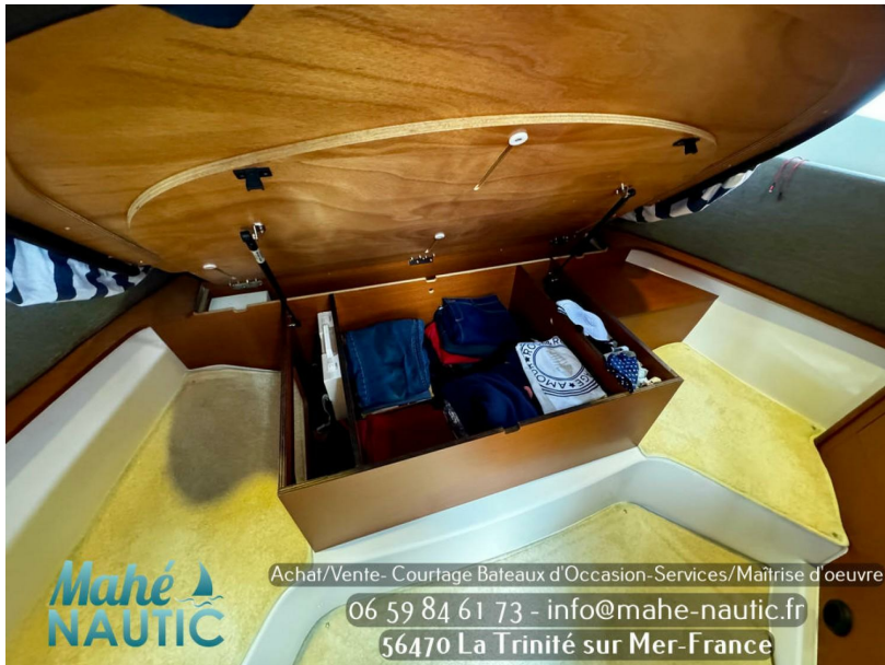
Achat/Vente- Courtage Bateaux d'Occasion-Services/Maîtrise d'oeuvre 06 59 84 61 73 - info@mahe-nautic.fr 56470 La Trinité sur Mer-France