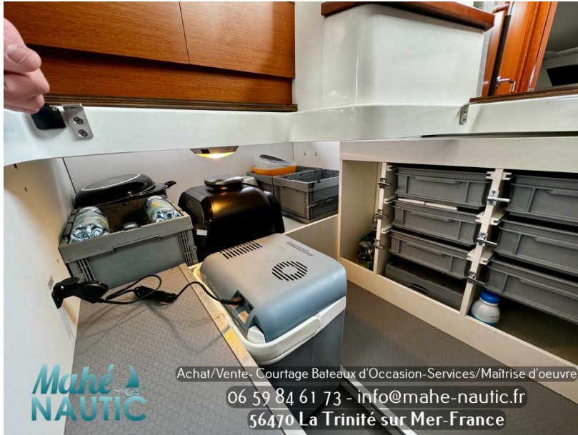
Achat/Vente- Courtage Bateaux d'Occasion-Services/Maîtrise d'oeuvre 06 59 84 61 73 - info@mahe-nautic.fr 56470 La Trinité sur Mer-France