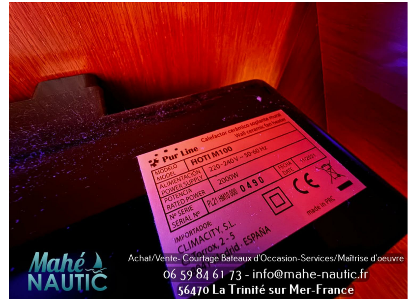
Achat/Vente- Courtage Bateaux d'Occasion-Services/Maîtrise d'oeuvre 06 59 84 61 73 - info@mahe-nautic.fr 56470 La Trinité sur Mer-France