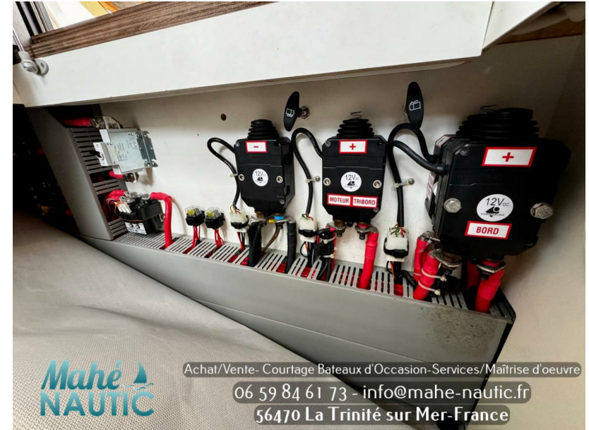
Achat/Vente- Courtage Bateaux d'Occasion-Services/Maîtrise d'oeuvre 06 59 84 61 73 - info@mahe-nautic.fr 56470 La Trinité sur Mer-France