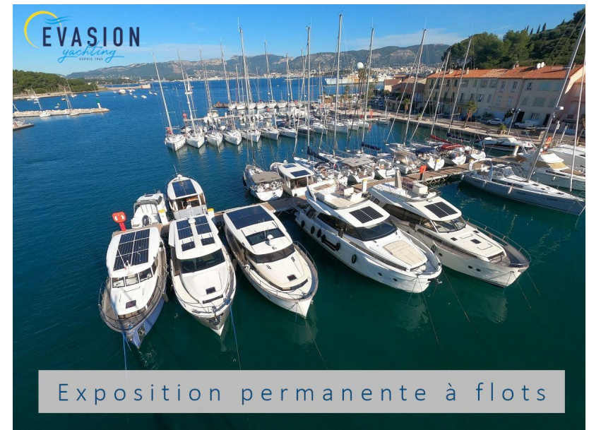
Exposition permanente à flots