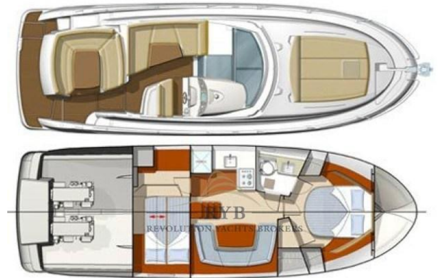
Garroni Designers - JEANNEAU Prestige 38 s - octobre 2007