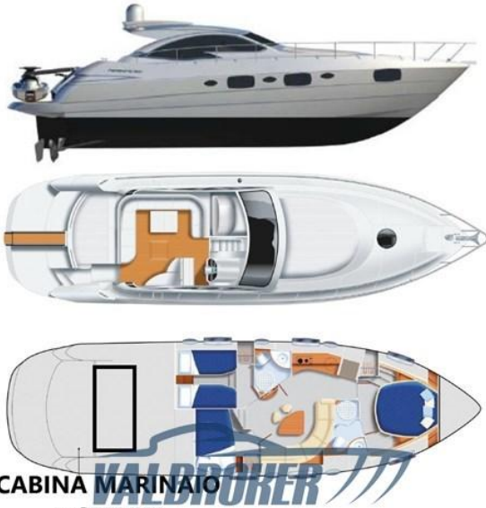
CABINA MARINAIO + SERVIZI