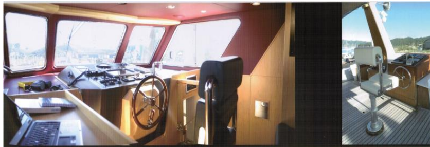
WHEELHOUSE / PLANCIA DI COMANDO