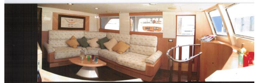
MAIN SALOON / SALONE PRINCIPALE DI PRUA