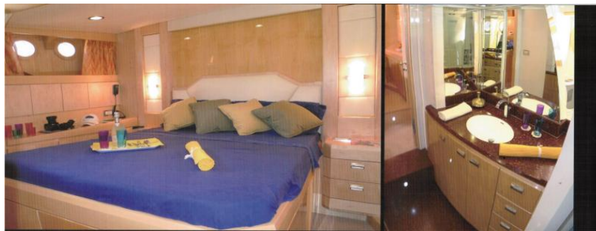
OWNER'S CABIN / CABINA ARMATORIALE