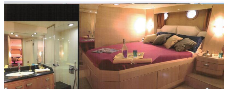
VIP CABIN / CABINA VIP