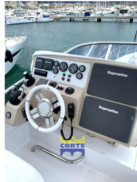
Azimut 64 Fly Layout: