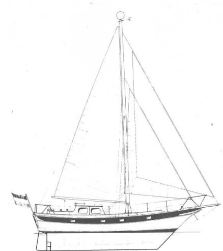
FAHRENSMANN-36 - KLIPPER GEWICHT 850 kg GEWICHT IN TONNEN 0,85 t PROF. 1000 mm KLASSE 1000 mm ANWINK. 1000 mm LÄNGE OBER STEVEN 10,70 m GRÖSSTE BREITE 3,40 m TIEFANG 1,21 m VERDRÄNGUNG 10,20 m 3 VERBAND Uecker YACHT- und BOOTWERFT RENDSBURG

VERBAND Uecker YACHT- und BOOTWERFT RENDSBURG