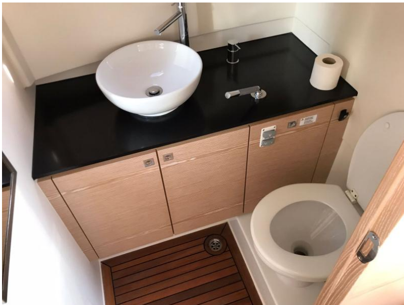
FJORD 36 open | exterior & interior layouts