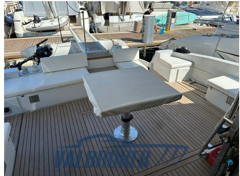
RAFFAELLI STORM S - REFITTING 2024