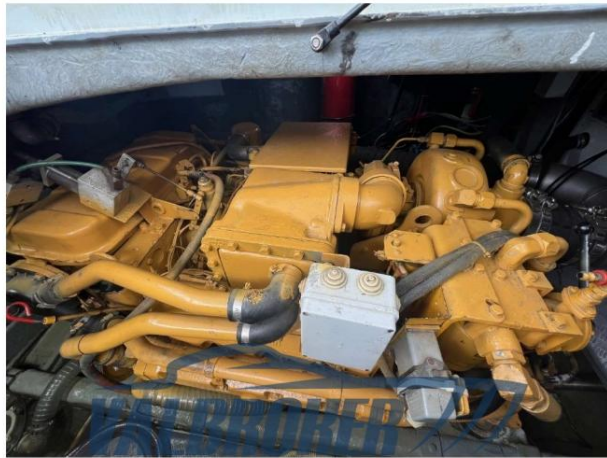
RAFFAELLI STORM S – REFITTING 2024