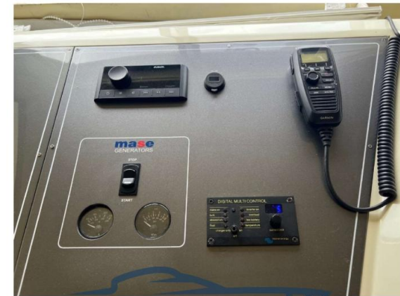
RAFFAELLI STORM S – REFITTING 2024

VALBROKER PANNELLO LATERALE CRUSCOTTO INTERNO NUOVO 2024 INTEGRATO CON COMANDI GENERATORE MASE 6,5 KW E PANNELLO CONTROLLO CARICABATTERIE INVERTER 2KW VICTRON NUOVO 2024