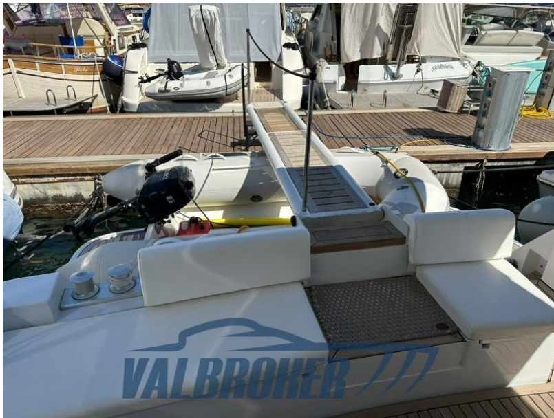
RAFFAELLI STORM S - REFITTING 2024