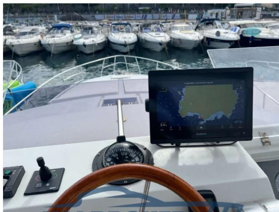
RAFFAELLI STORM S – REFITTING 2024

VALBROKER PLANCIA COMANDO FLY CON GPS GARMIN 12" NUOVO 2024 E NUOVA BUSSOLA