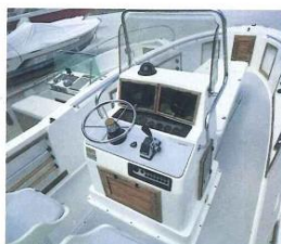
La vista della consolle centrale evidenzia la cura riposta nella protezione della strumentazione coperta da sportelli di plexiglass.

Il cantiere Aquasport in questo panorama si è guadagnato un posto di tutto rispetto con una mirata e concentrata produzione da 17 a 31 piedi divisa in dodici modelli dei quali i cinque più rappresentativi sono importati dalla omonima società con sede a Roma, consociata con la Plana di Orbetello. Il 250 CCP (central console professional) è il modello più importante di quelli disponibili sul nostro mercato; come la sigla lascia intuire si tratta di un'imbarcazione molto specialistica e destinata a un pubblico di autentici intenditori. La carena, a V profonda, garantisce un eccellente passo sull'onda in tutte le condizioni di mare; l'opera morta si presenta abbastanza importante e il disegno grafico della fiancata tende a donare maggiore slancio all'insieme. La scelta della consolle centrale è praticamente d'obbligo su una barca con queste caratteristiche ma molto