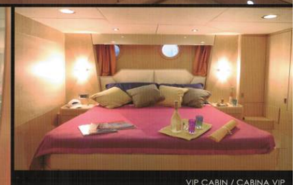
VIP CABIN / CABINA VIP