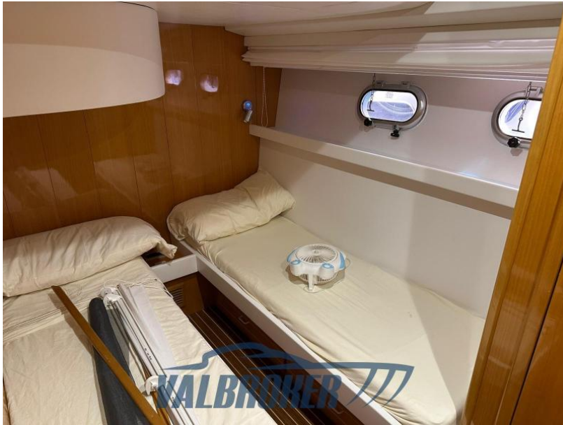
RAFFAELLI STORM S - REFITTING 2024