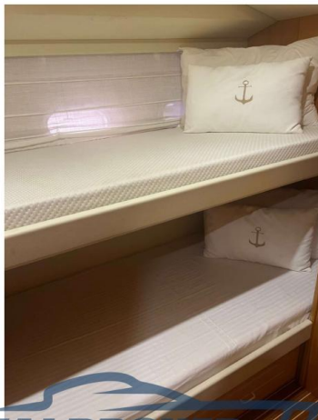
AVVIA I SERVIZI CON I LETTI A CASERMI CON I POGGIOLI E I NEZZI E I MATERASSI NUOVI 2024