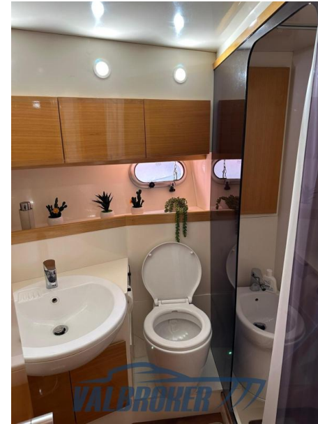
RAFFAELLI STORM S - REFITTING 2024