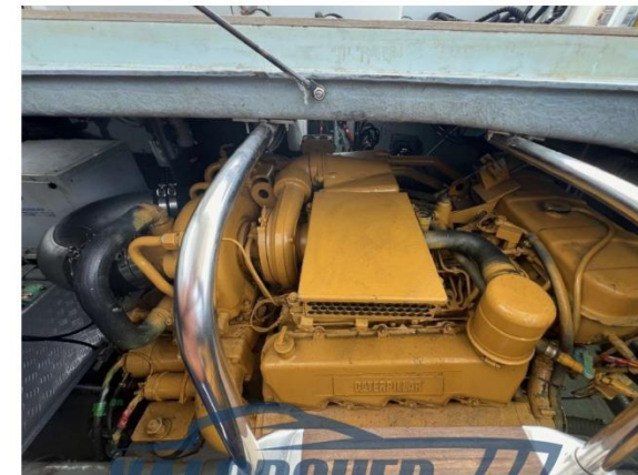
MOTORI SBARCATI AD ORE ZERO ANNO 2024