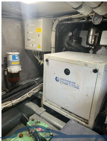
RAFFAELLI STORM S – REFITTING 2024