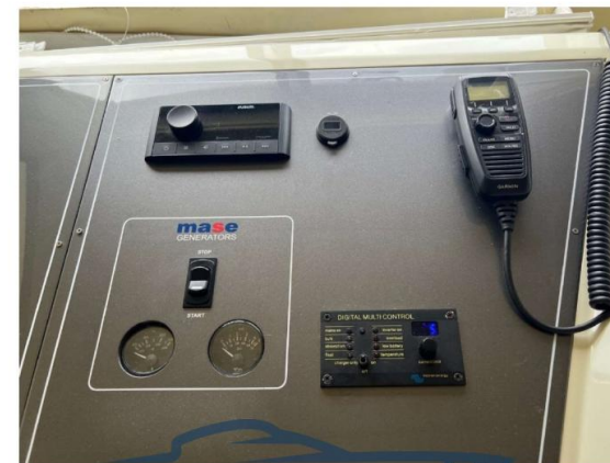
PANNELLO LATERALE CRUSCOTTO INTERNO NUOVO 2024 INTEGRATO CON COMANDI GENERATORE MASE 6,5 KW E PANNELLO CONTROLLO CARICABATTERIE INVERTER 2KW VICTRON NUOVO 2024