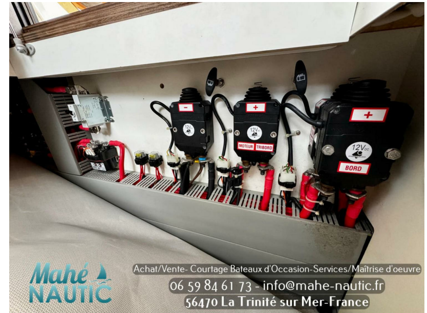
Achat/Vente- Courtage Bateaux d'Occasion-Services/Maîtrise d'oeuvre 06 59 84 61 73 - info@mahe-nautic.fr 56470 La Trinité sur Mer-France