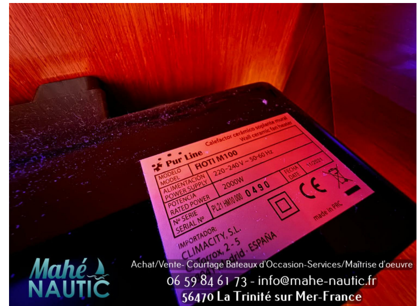
Achat/Vente- Courtage Bateaux d'Occasion-Services/Maîtrise d'oeuvre 06 59 84 61 73 - info@mahe-nautic.fr 56470 La Trinité sur Mer-France