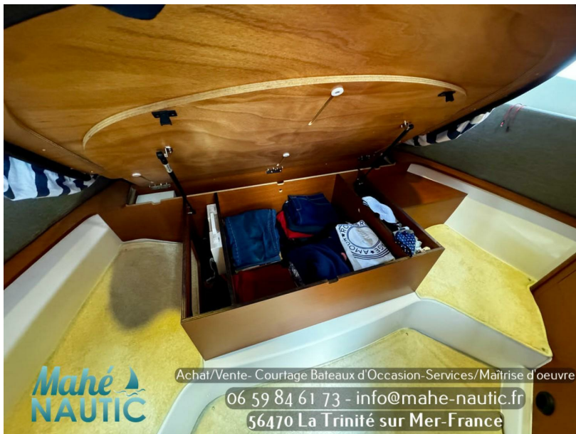
Achat/Vente- Courtage Bateaux d'Occasion-Services/Maîtrise d'oeuvre 06 59 84 61 73 - info@mahe-nautic.fr 56470 La Trinité sur Mer-France