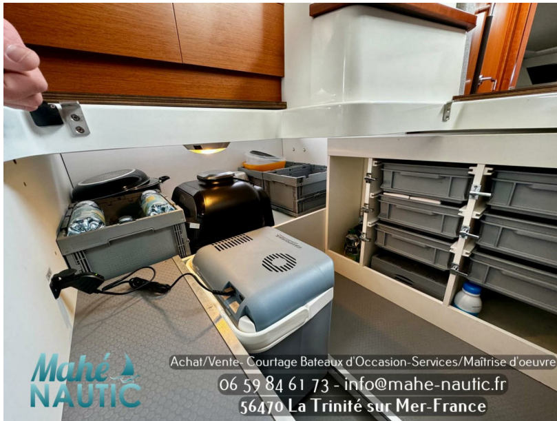
Achat/Vente- Courtage Bateaux d'Occasion-Services/Maîtrise d'oeuvre 06 59 84 61 73 - info@mahe-nautic.fr 56470 La Trinité sur Mer-France